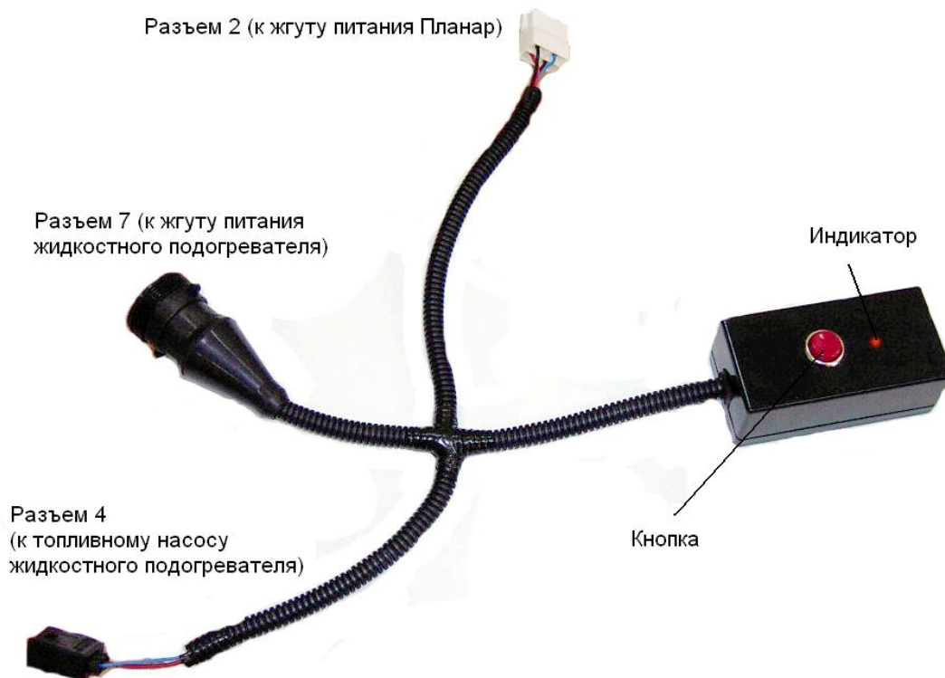
Рис. 2 — Внешний вид устройства подкачки топлива